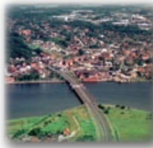
Der, hvor Mariager Fjord er smallest, ligger Hadsund.