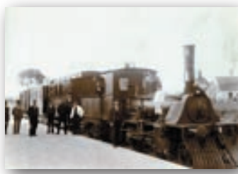
Toget blev i folkemunde omtalt »Hadsundpeter«.

Hadsundrutens forløb er næsten identisk med det nedlagte jernbanestrækning fra Hadsund til Aalborg. Jernbanen fungerede i perioden 1900 til 1969. I 1982 blev banestrækningen mellem Visborg og Vårst fredet med det formål at anlægge en cykel- og gangsti.