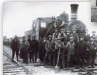
Solbjerg Station omkring år 1900.

Men i 1969 måtte banen indstille driften. Dens funktion var indhentet af udviklingen, og transport og befordring foregik nu ad landevejen.